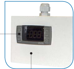
Remote control panel