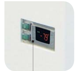
Electronic control instrument